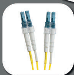
Klasični optični priključni kabli