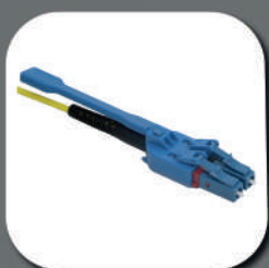
LC "Uniboot HD" Pull Tab